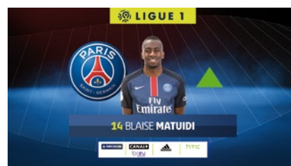
changement de joueur.